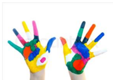
Тимот на OSHC

Посетете ја https://childrensprogramms.ymca.org.au/before-after-school-programms/kororoit-creek-primary за повеќе информации, запишување и резервација.